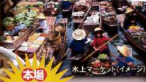
水上マーケット(イメージ)