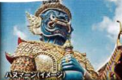
ハヌマーン(イメージ)