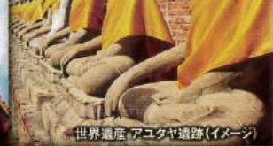
世界遺産 アユタヤ遺跡(イメージ)