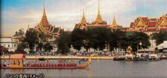
バンコク市内(イメージ)